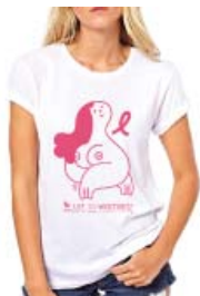
T-shirt Nastro Rosa ed. 2021 disegnata dall'illustratrice Ilaria Faccioli.

Settembre e per tutto il mese di Ottobre sarà possibile sottoporsi ad una visita senologica di controllo gratuita su appuntamento presso il Poliambulatorio di Via B. Bosco 31/10.